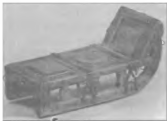
Санки для рождественских катаний (XVI в.)

Многие историки в качестве доказательства патологической жестокости и беспощадности