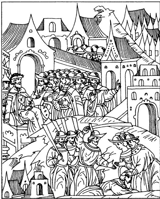
Иван Грозный отдает Шуйского псарям на казнь (с миниатюры XVI в.)

Ивана часто используют тот факт, что свой первый смертный приговор Грозный вынес уже в 13 лет. Однако вряд ли этот аргумент что-либо доказывает. Во-первых, как государь Иван должен был выносить приговоры (в том числе и достаточно часто — смертные) вне зависимости от возраста, просто в силу занимаемого им положения. Во-вторых, иного наказания за беззакония и узурпацию власти по тогдашним правилам и не предполагалось. В-третьих, жестокость способа казни могла быть выбрана для наглядности и урока тем, кто собирался претендовать на освободившееся место в государственном управлении. И наконец, по нормам XVI в. совершеннолетие наступало в 15 лет, а средняя продолжительность жизни по тем временам ограничивалась 27 годами, поэтому 13-летний возраст Ивана не может свидетельствовать о его социальной незрелости.