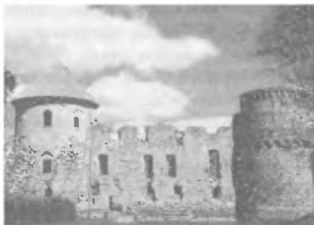
Ливонский замок в Цесисе (Великое княжество Литовское, XIII—XV вв.)

ные дворы о том, что государь достиг взрослого возраста и подумывает о браке.